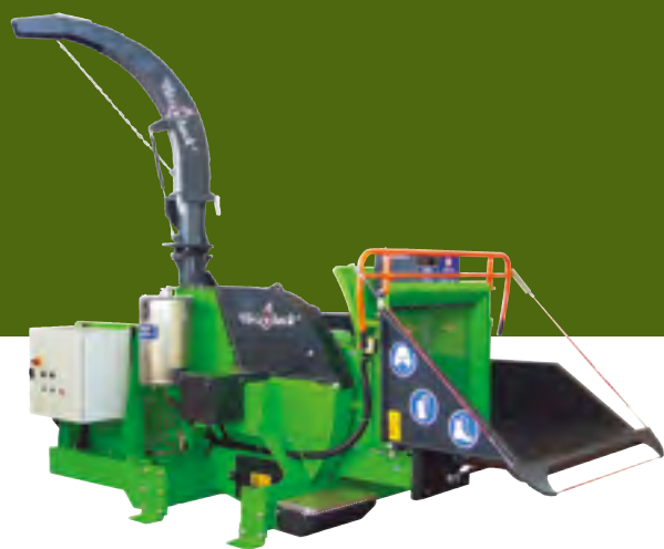
Trémie hydraulique d'alimentation en option