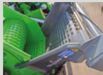
Table d'alimentation rabattable en entonnoir