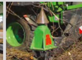
Cône fendeur en option