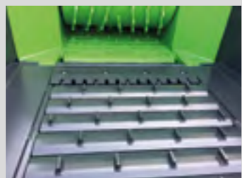
Table d'alimentation puissante, rabattable en entonnoir avec tapis à vitesse réglable, renforcé par patins de Hardox.