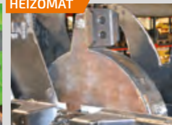
Soufflerie à volant d'inertie d'1 T = réserve de puissance ⊙conso, ⊙régul, ⊙solllicitation moteur et rotor ⊕puissance/force, ⊕régularité