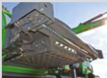
Rouleau hydraulique d'amenée à l'avant du tapis