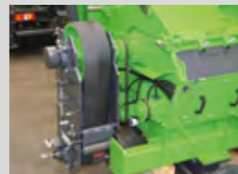
Transmission à courroies trapézoïdales