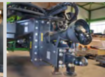
Hauteur d'attelage ajustable 500, 600, 900 ou 1000 mm