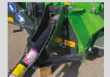
Adaptateur Hitch pour timon bas 500 mm (en option)