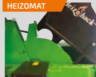
Soufflerie à volant d'inertie de 470 kg : éjection des plaquettes puissante + réserve de puissance.