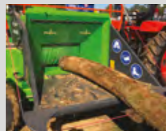
Système d'alimentation puissant : rouleau Ø 400 mm et tapis ameneur en acier à dents d'entraînement soudées.