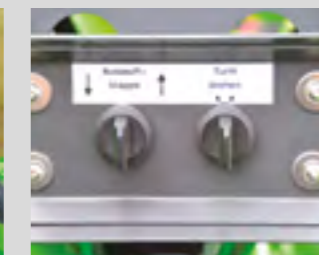
Goulotte orientable et casquette d'éjection réglable électriquement en option.