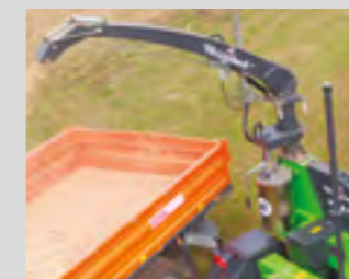
Goulotte orientable manuellement, casquette d'éjection réglable de série.