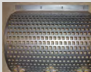
Grilles de calibrage disponibles : 25/25 mm, 35/40 mm, 45/60 mm, 60/80 mm