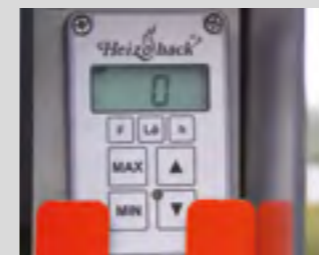
Système de commande no-stress Heizohack HE 002 pour réguler l'avancée du bois en fonction de la puissance d'entraînement.