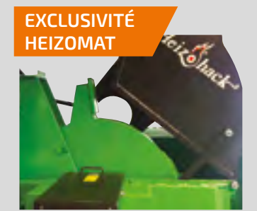
EXCLUSIVITÉ HEIZOMAT Soufflerie à volant d'inertie de 130 kg : éjection des plaquettes puissante + réserve de puissance.