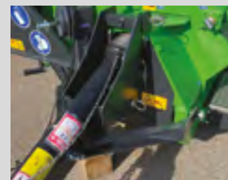
Adaptateur Hitch pour attelage bas (en option)