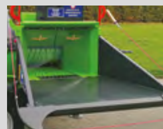
Système d'alimentation puissant rouleau et tapis ameneur en acier à dents d'entraînement soudées