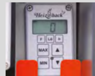
Système de commande no-stress (idem gros broyeurs) pour réguler l'avancée du bois à déchiqeter