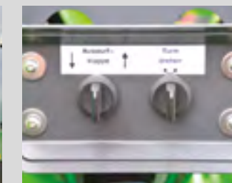
Goulotte orientable et casquette d'éjection réglable électriquement en option.