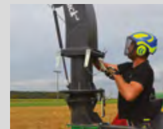
Goulotte orientable manuellement et casquette d'éjection réglable de série.