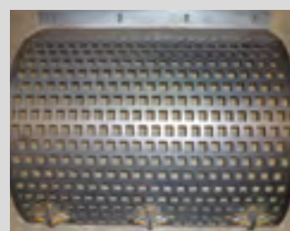
Grilles de calibrage disponibles : 25/25 mm, 35/40 mm, 50/50 mm