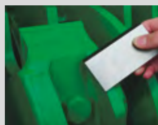
Rotor à couteaux à changement rapide affûtables et réglables